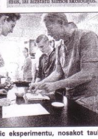
Skolēni veic eksperimentu, nosakot tauku daudzumu desā.

Decembra nogalē kļuva skaidrs, ka situācija ir ļoti nopietna, jo daudzās skolās spiestas izmantot nevalificētu darbinieku pakalpojumus, lai aizstātu slimos skolotājus.