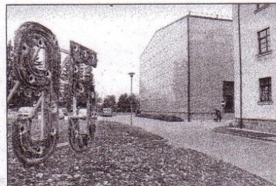
Ikvienam, kurš dodas cauri skolas teritorijai, top skaidrs: Talsu Valsts ģimnāzija šogad atzīmē ievērojamu jubileju!